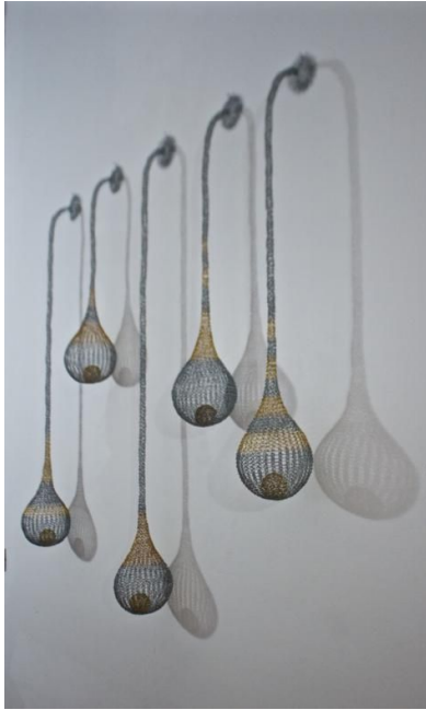
Gouttes, fils métalliques

S'arrêter sur la nature des choses végétales, animales ou minérales.