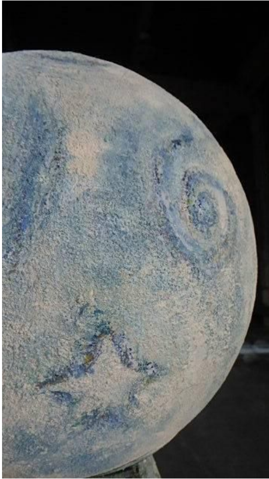
Planisphère céleste , peinture et pigments naturels

Claire Guerry, artiste multi-faces, crée des états, des forces, des silences ; Ponts entre visible et invisible.